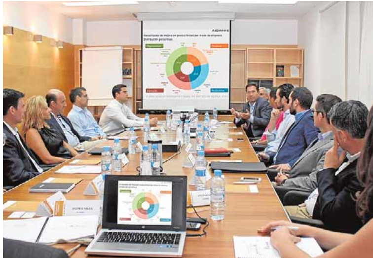
Análisis de situación con empresas en una imagen prepandemia. R. S.

En la actualidad, la evolución de los observatorios pasa por la ampliación de sus focos de observa-